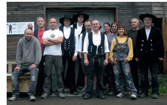
Mitarbeiter und Kooperationspartner

Bei gutem Wetter auf dem Gelände des Rittergutes, bei schlechtem im Herrenhaus